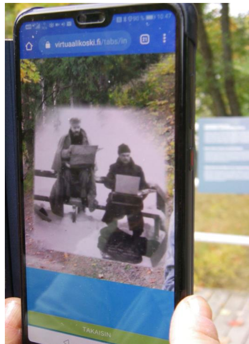
Kuva 1. Virtuaalikoski-sovelluksen kautta pääsee samaan paikkaan, jossa taitelijat Akseli Gallen-Kallela ja Albert Edelfelt maalasivat koskea talvella 1893.

Erilaisten virtuaalitodellisuuden ratkaisujen pohdintaan lähdettiin FIVRn (Finnish Virtual Reality Association) avulla. Itse konseptia lähdettiin työstämään hallituksen kärkihankkeen, Blue projectin kanssa, jota toteutti Haaga-Helia ammattikorkeakoulu. Blue-hanke varasi työhön opiskelijaryhmän. Työ eteni palvelumuotoilun kautta: koskinäytöksen katsojille julkaistiin kysely sekä suomeksi että venäjäksi siitä, minkälainen virtuaalisen koskinäytöksen pitäisi olla ja mitä sisältöjä ja asioita sen vastaajien mielestä tulisi tuoda esille. Kyselyn jälkeen vastaajista koottiin asiakasraati käymään läpi kyselyn tuloksia ja kiteyttämään niitä asioita, joita kyselyssä oli tullut esille. Tärkeimmiksi asioiksi vastaajat totesivat kosken historian ja luontoelämyksen esiin tuomisen.