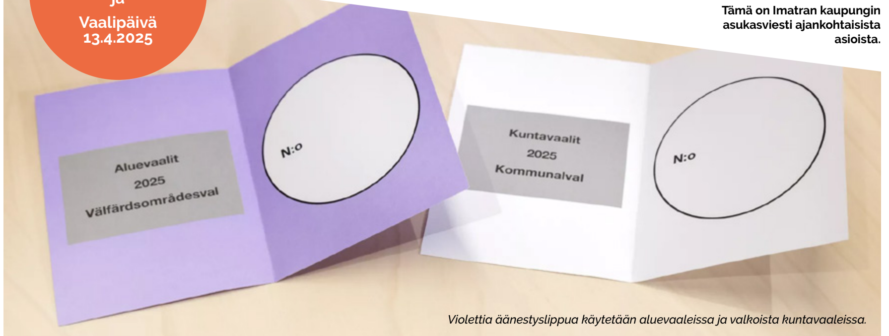
Violettiä äänestyslippua käytetään aluevaaleissa ja valkoista kuntavaaleissa.

Ennakkovaalit 2.–8.4. ja Vaalipäivä 13.4.2025