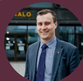
Kirjoittaja Matias Hilden on Imatran kaupunginjohtaja.

Voimme jokainen vaikuttaa hallayön päättymiseen omalla myönteisellä asenteella. Voimme surkutella mennyttä, mutta voimme myös rakentaa tulevaa. Jokainen imatralainen voi itse valita kummalla puolella haluaa olla.