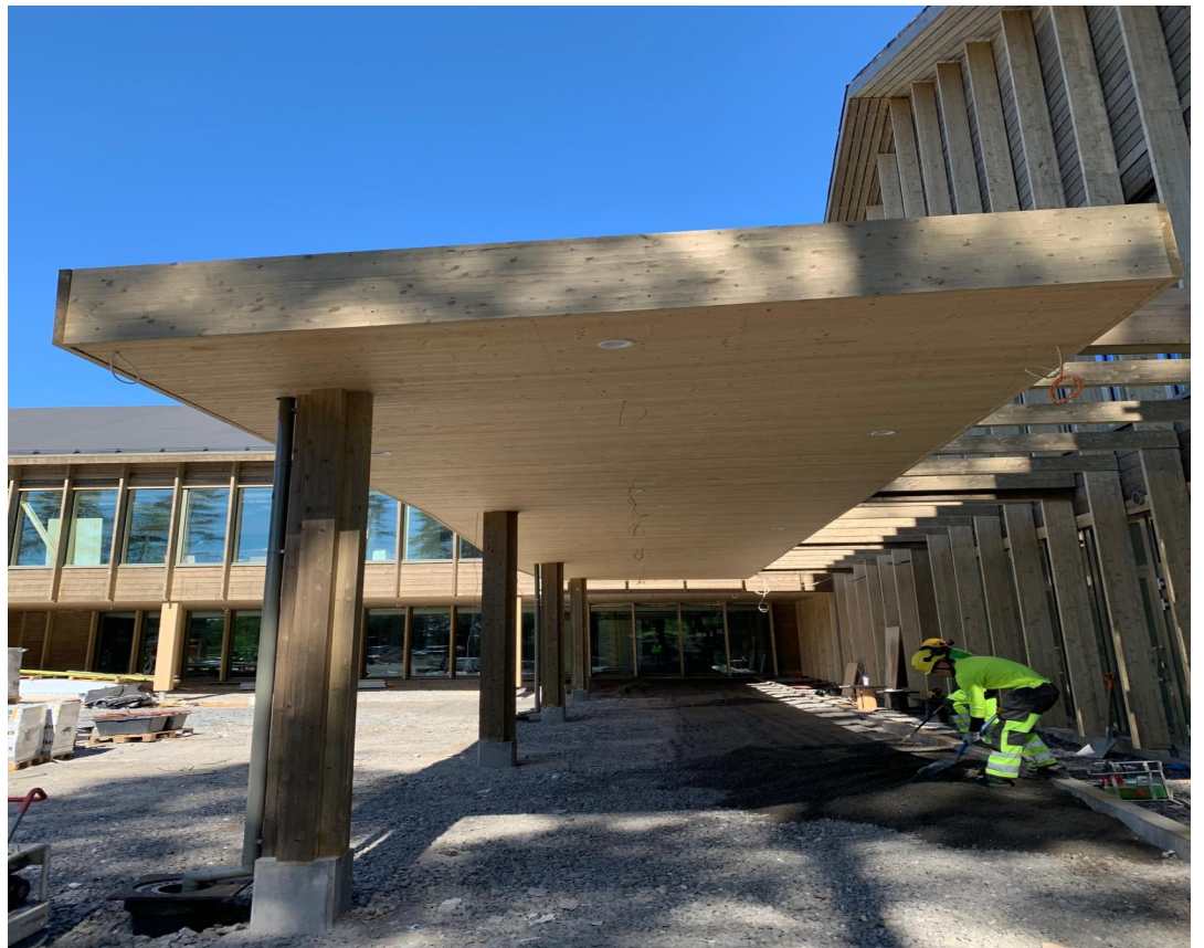
Sisäpihan sisäänkäynnin katos verhoiltu ja kivityöt käynnissä