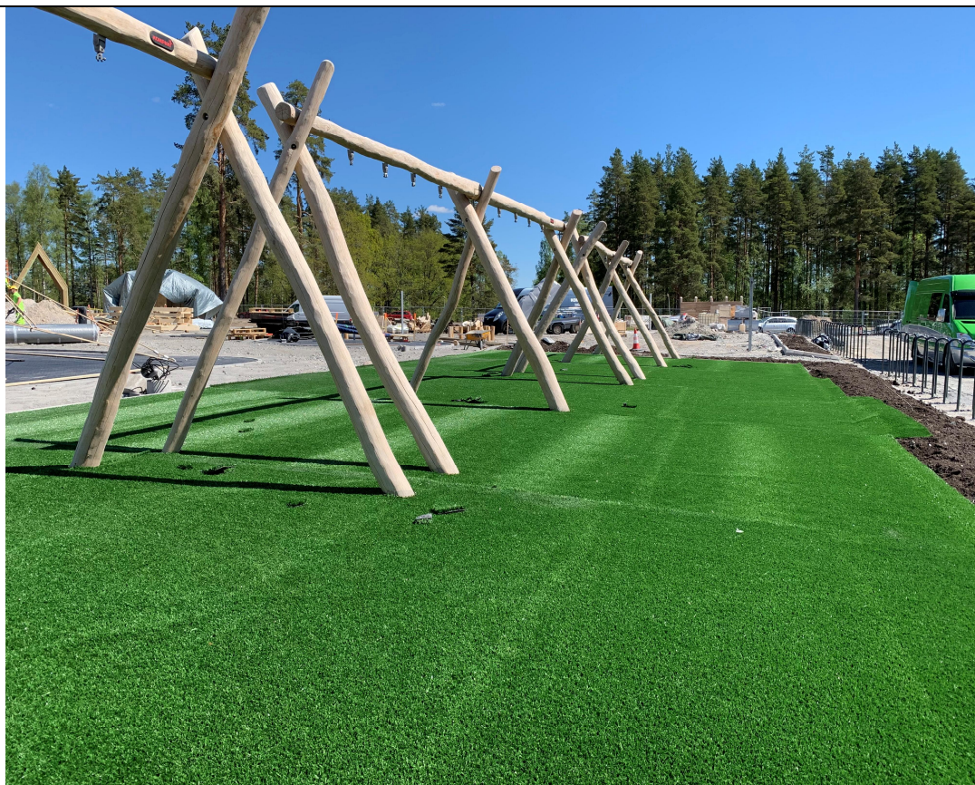
Keinujen alle asennellaan turva-alustaa