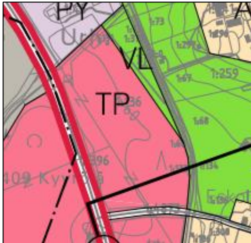
Kuva 4. Kaavaote yleiskaavasta Kestävä Imatra 2020

Yleiskaavassa suunnittelualue on osoitettu työpaikka-alueeksi (TP).