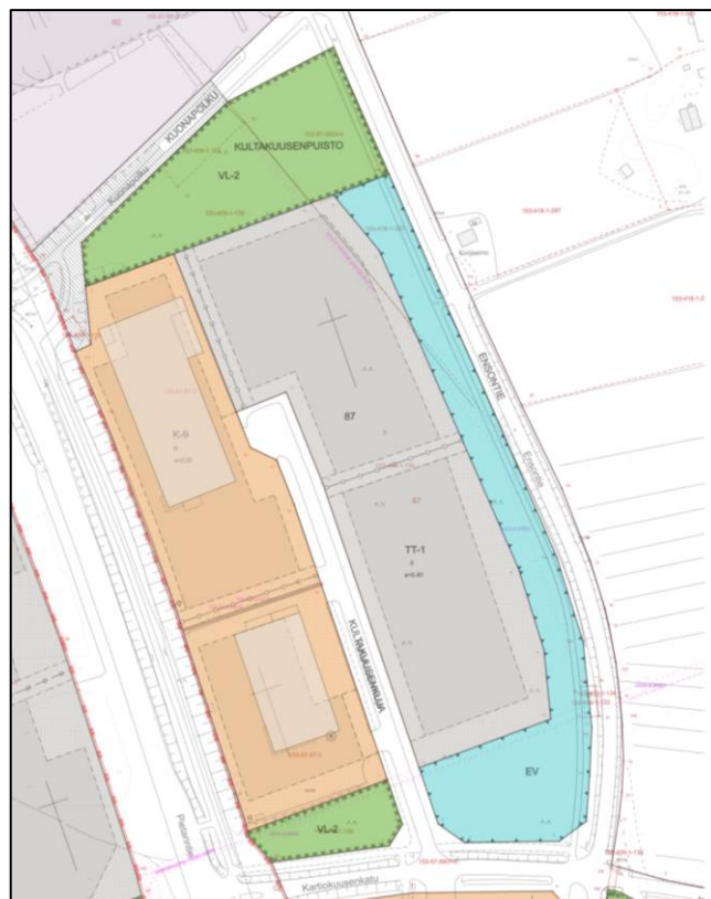
Kuva 5. Ote ajantasa-asemakaavasta.

Kiinteistö 153-409-1-139 on teollisuusrakennusten korttelialuetta (TT-1). Alueelle saa sijoittaa huoltoasematiloja sekä liikennettä ja tukkukauppaa palvelevia rakennuksia. Tonteilla tapahtuva toiminta ei saa aiheuttaa terveydellistä haittaa eikä asemakaavan mukaiselle asutukselle saa aiheuttaa kohtuutonta haittaa hajun, savun, pölyn, noen ja kaasujen muodossa. Asutukselle aiheutuva ulkoinen melutaso ei saa ylittää ulkona klo 7.00-22.00 melun ekvivalenttitason ohjearvoa 55 dB L(Aeq) eikä yöohjearvoa klo 22.00 – 7.00 50 dB L(Aeq).